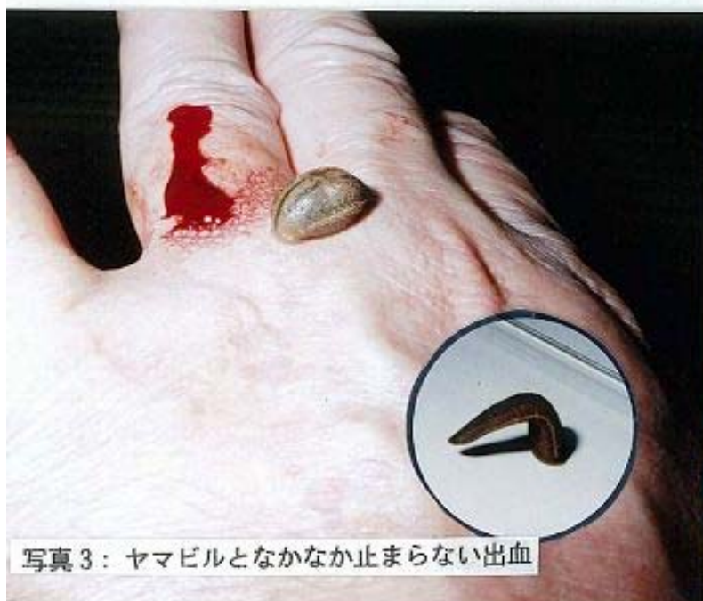
写真3：ヤマビルとなかなか止まらない出血