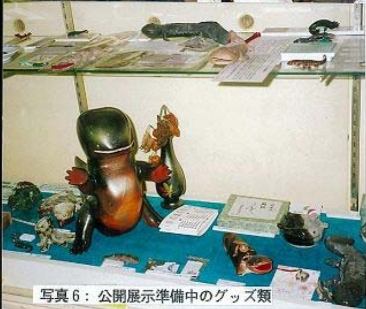
写真6：公開展示準備中のグッズ類