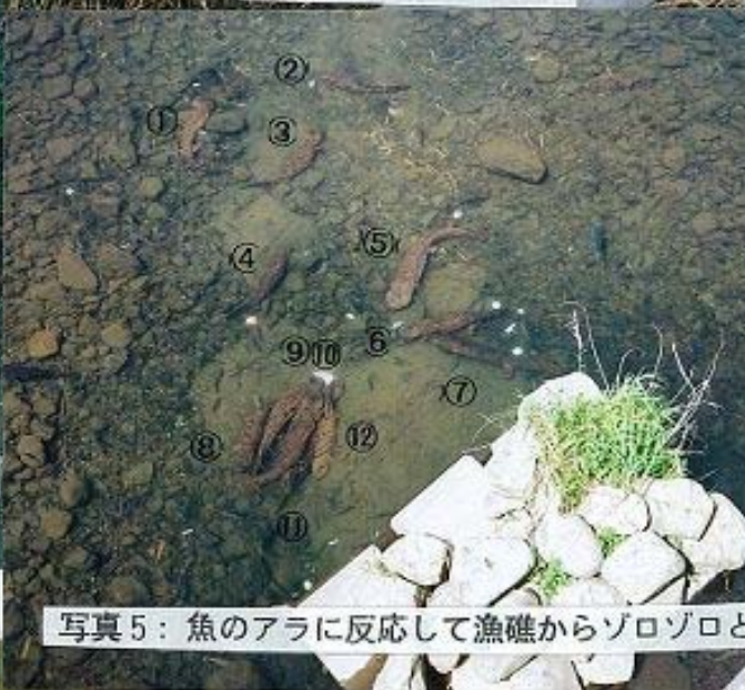
写真5：魚のアラに反応して漁礁からゾロゾロと