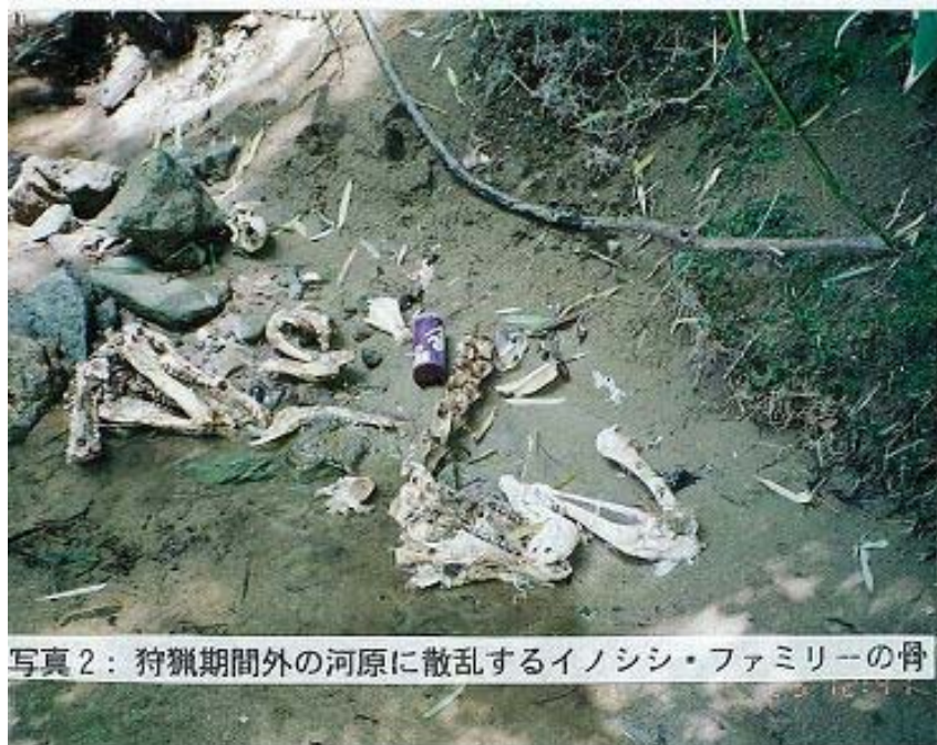
写真2：狩猟期間外の河原に散乱するイノシシ・ファミリーの骨