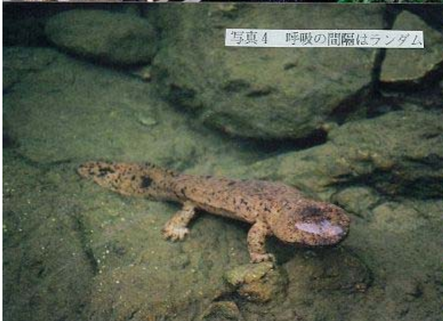
写真4 呼吸の間隔はランダム