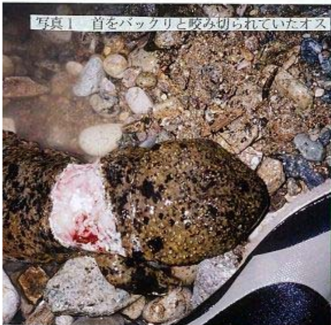
写真1 首をバツクリと咬み切られていたオス