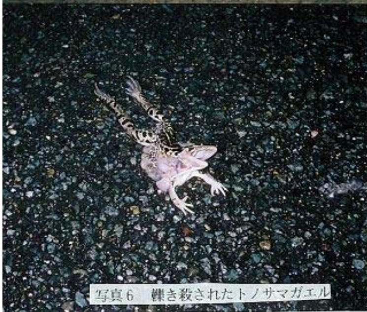
写真6 裸き殺されたトノサマガエル